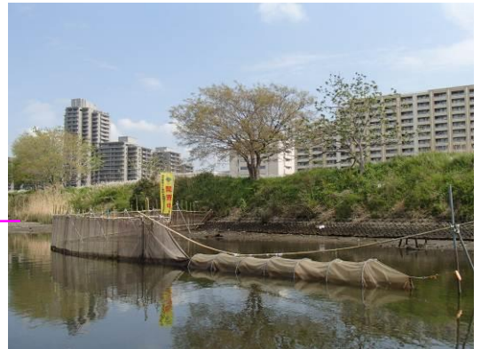
<多摩川下流に設置した定置網>