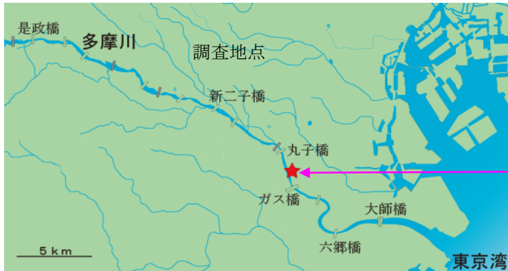
<調査地点（大田区下丸子 4 丁目付近）>