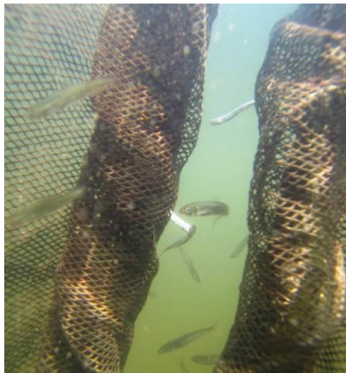
<定置網に入網するアユ>