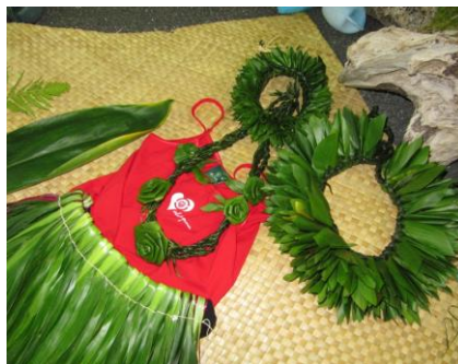
写真1 フラで使用するレイ