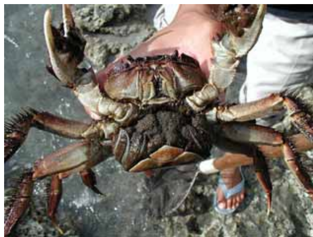
図2 産卵のために降りてきたオガサワラモクスガニ(小港)