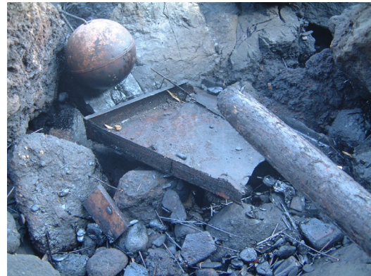
図6 海岸に打ち上がった油と部品類