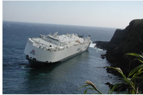
図2 座礁直後の座礁船の様子