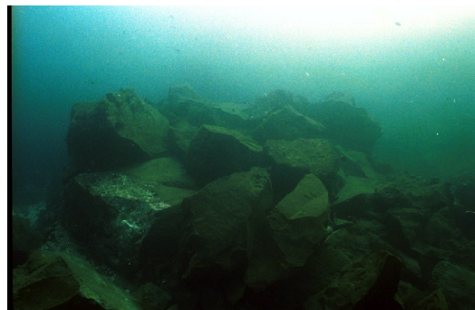
図8 割れた海底の岩