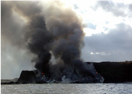
図3 火災炎上中の座礁船の様子