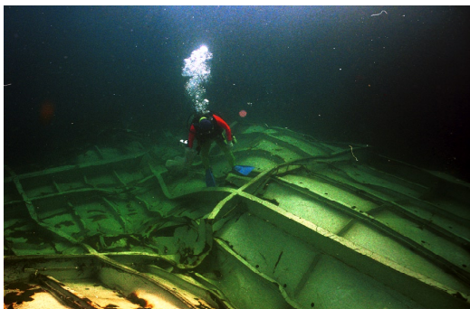
図7 海底に散乱する鉄板