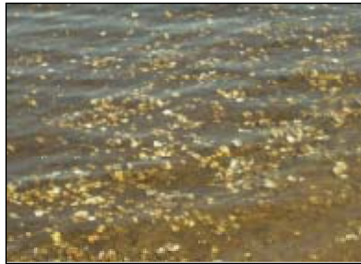
写真1 打ち上げられた貝