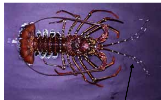
図3 シラヒゲエビ 第1触覚に縞模様