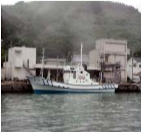
図3 母島沖港に入港中の調査船「興洋」