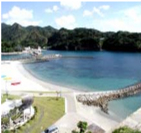
図3 小笠原母島沖港(2001年12月)