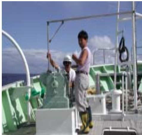
図3 海洋観測作業の様子