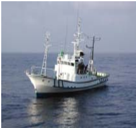
図3 調査指導船「興洋」