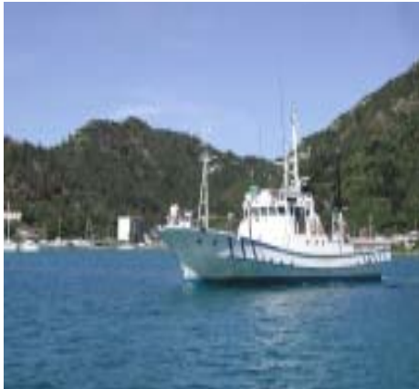
図3 帰港する調査指導船「興洋」