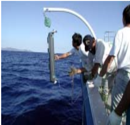
図3 分析用海洋深層水の採水(父島東方沖) ニスキン型採水器を使用