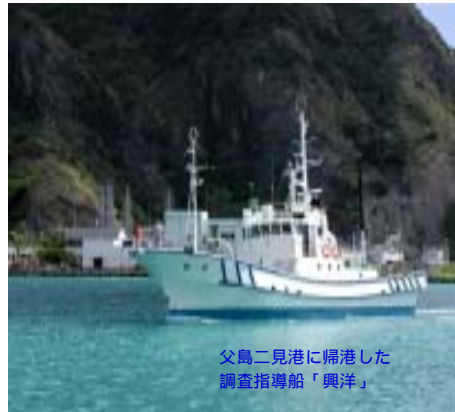
父島二見湾に帰港した調査指導船「興洋」