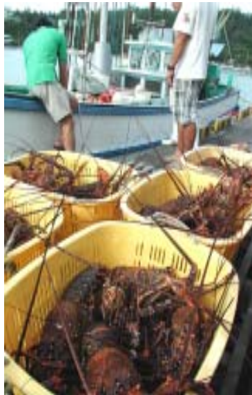
父島ではいせえび漁が解禁されました

「海洋島」は毎月1回発行しています。バックナンバーのご請求やお問合せ等は、水産センター(担当:ニシキオリ)までお気軽にご連絡ください。また、小笠原の海の環境や漂流物等に関する情報をお持ちの方はご一報いただけるようにお願いいたします。