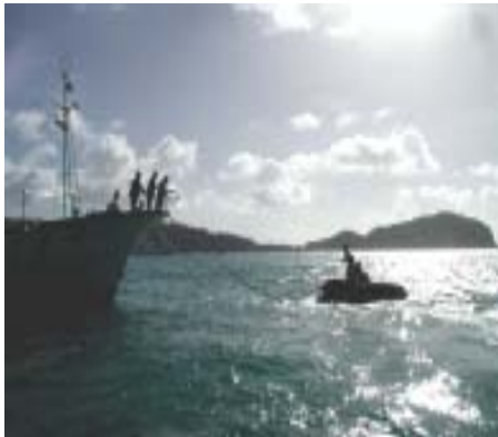
写真1 台風25号通過後の父島二見湾 避難係留ブイ舫い解除作業中の調査船「興洋」 普段は澄んだブルーの小笠原の海もこの日は濁りがひどく、クリームソーダとミルクコーヒーを混ぜたような色でした