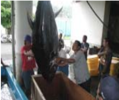
図1 父島から出荷されるクロマグロ