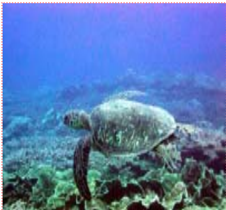
図1 のんびり泳いでいるアオウミガメ