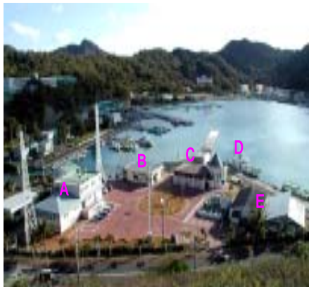
写真1 小笠原水産センター全景