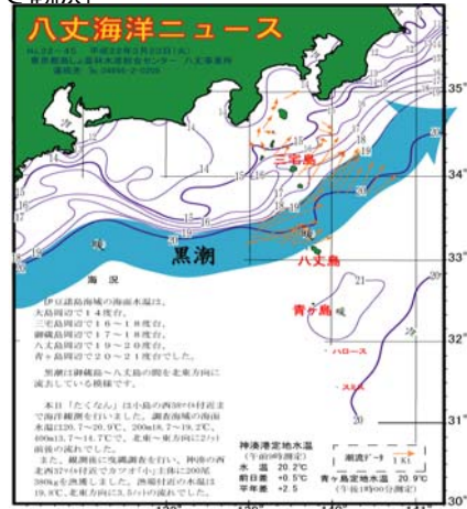
図2 沿岸観測当時の黒潮流路 八丈海洋ニュースNo.22-45(3/23号)より