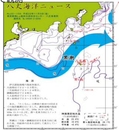
図2 沿岸観測当時の黒潮流路 八丈海洋ニュースNo.22-156(11/5号)より