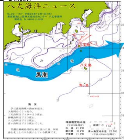
図2 沿岸観測当時の黒潮流路 八丈海洋ニュースNo.22-167(12/1号)より