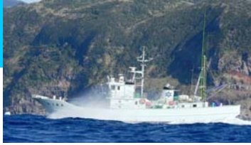
調査指導船「みやこ」