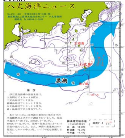
図2 沿岸観測当時の黒潮流路 八丈海洋ニュースNo.23-40(3/14号)より