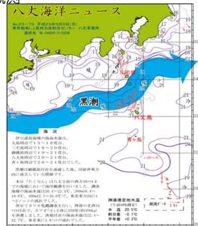
図2 沿岸観測当時の黒潮流路 八丈海洋ニュースNo.23-75(5/9号)より