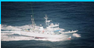
調査指導船「たくなん」

〒100-1511 東京都八丈島八丈町三根4222 TEL : 04996-2-0209 FAX : 04996-2-3429