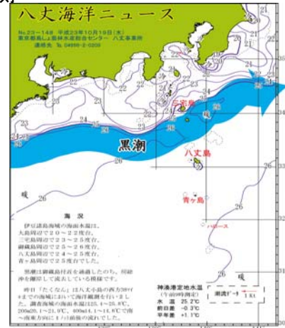
図2 沿岸観測当時の黒潮流路 八丈海洋ニュースNo.23-148(10/19号)より