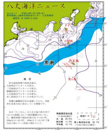
図2 沿岸観測当時の黒潮流路