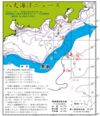
図2 沿岸観測当時の黒潮流路