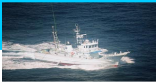
調査指導船「たくなん」