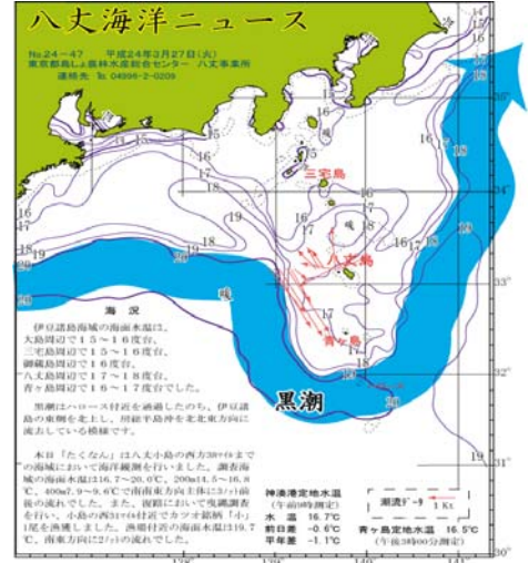
図2 沿岸観測当時の黒潮流路