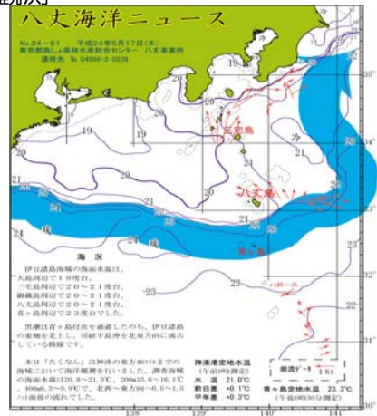
図2 沿岸観測当時の黒潮流路 八丈海洋ニュースNo.24-81(5/17号)より