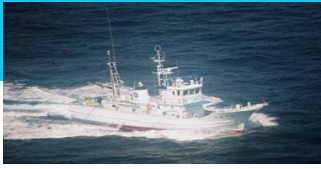
調査指導船「たくなん」

〒100-1511 東京都八丈島八丈町三根4222 TEL : 04996-2-0209 FAX : 04996-2-3429