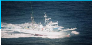
調査指導船「たくなん」