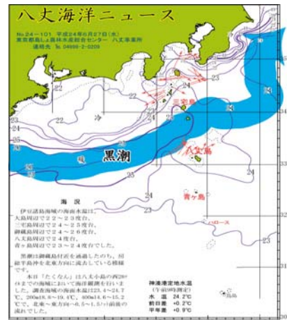
図2 沿岸観測当時の黒潮流路