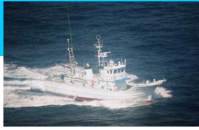
調査指導船「たくなん」