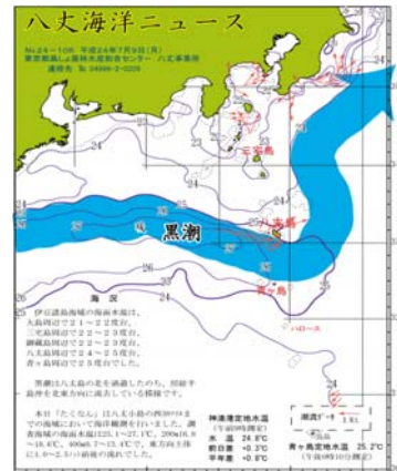
図2 沿岸観測当時の黒潮流路 八丈島海洋ニュースNo.24-106(7/9号)より