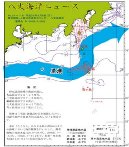
図2 沿岸観測当時の黒潮流路 八丈海洋ニュースNo.24-118(8/6号)より