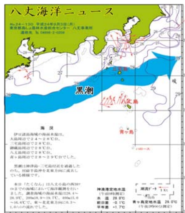
図2 沿岸観測当時の黒潮流路 八丈海洋ニュースNo.24-130(9/3号)より