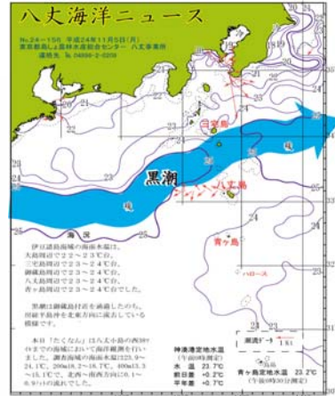
図2 沿岸観測当時の黒潮流路 八丈海洋ニュースNo.24-156(11/5号)より