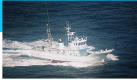
調査指導船「たくなん」