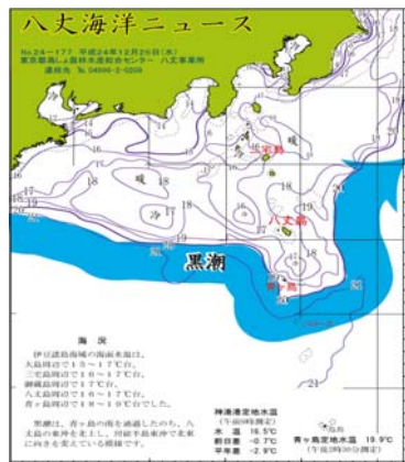
図2 沿岸観測当時の黒潮流路 八丈海洋ニュースNo.24-177(12/26号)より