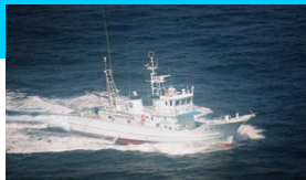
調査指導船「たくなん」