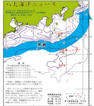
図2 沿岸観測当時の黒潮流路 八丈海洋ニュースNo.25-30,33(3/4,7号)より