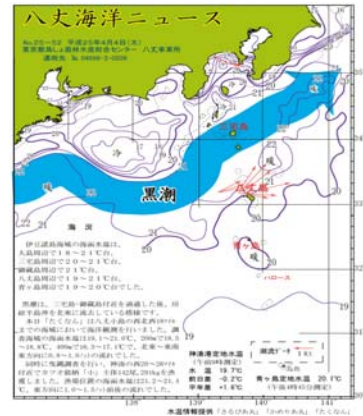
図2 沿岸観測当時の黒潮流路 八丈海洋ニュースNo.25-52(4/4号)より