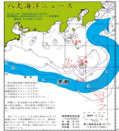
図2 沿岸観測当時の黒潮流路 八丈海洋ニュースNo.25-94(6/10号)より