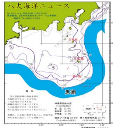
図2 沿岸観測当時の黒潮流路 八丈海洋ニュースNo.25-143(10/2号)より