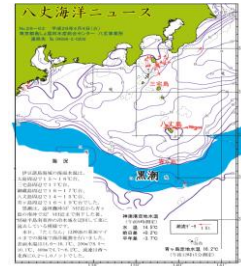
図2 沿岸定点観測時の黒潮流路