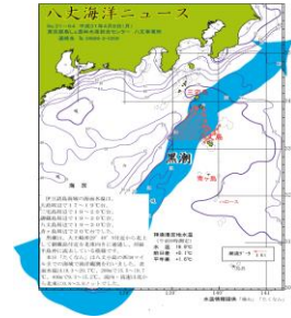
図2 沿岸定点観測時の黒潮流路