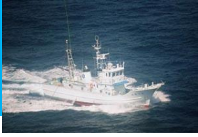
調査指導船「たくなん」