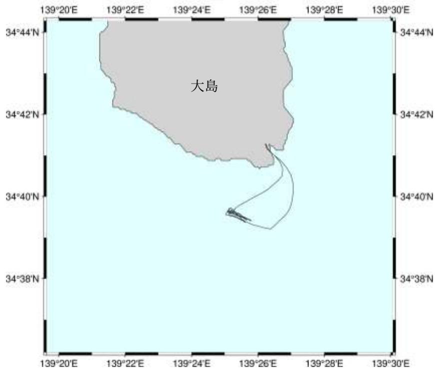
図1 漁業調査指導船「みやこ」航跡図