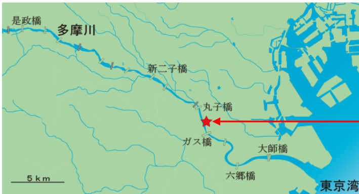
<調査地点（大田区下丸子4丁目付近）>